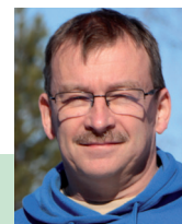
Beiträge für „DXtra“ an: Enrico Stumpf-Siering, DL2VFR Hinter den Höfen 4 27305 Bruchhausen- Vilsen dl2vfr@darcd

Vielen Dank für die DX-Informationen an DX World of HAMRADIO, DX-News, IDXP, DL1SBF, DL3FF, DJ9ZB, NG3K, 425DXN und andere.