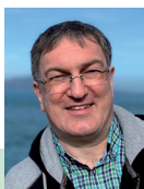
Beiträge für „DXtra“ an:

Ergänzend empfehle ich das DX-Mitteilungsblatt (DXMB), welches wöchentlich im PD-Format erscheint und unter https://www.darcdxhf.de/dxmb kostenlos abonniert werden kann.